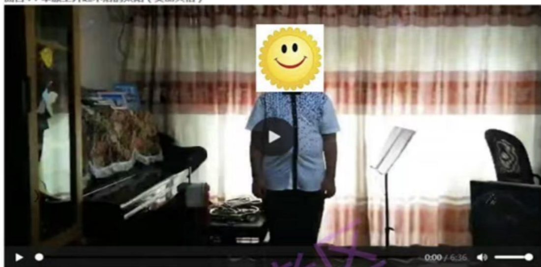
曲目4: 草原上升起不落太阳(美丽其格)

(4) 视频录制要求: 需要注意考生每首有(报幕)自报姓名, 专业、级别、曲目; 演唱或演奏时要一气呵成, 不得自行升降调、不得假唱、不得镜头切换、不得使用扩音设备。使用手机拍摄时, 演唱或演奏曲目录制时(可横屏), 画面间距尽量控制在 1.5 米~2.5 米, 着装得体大方。乐器演奏专业考级要求考生的人脸、手指、乐器在同一画面,